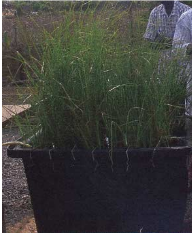
PHOTO 1 : Vue d'un des bassins à vetiver après deux mois de fonctionnement

Les prélèvements d'échantillons sont quotidiens et se font à l'entrée du bassin d'eau libre et à la sortie de chacun des trois bassins. Tous les jours, un échantillon instantané de 80 ml est prélevé à heure fixe et conservé dans un flacon gardé au surgélateur. Cette opération répétée pendant quinze jours successifs permet d'obtenir un échantillon moyen de 1200 ml sur lequel est réalisée l'analyse des matières en suspension (MES) et de la demande chimique en oxygène (DCO). Le dénombrement des coliformes fécaux (CF) est effectué sur un échantillon instantané prélevé le jour des analyses.